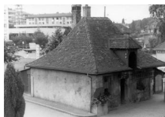
Maisonnnette des jardiniers au 20ème siècle