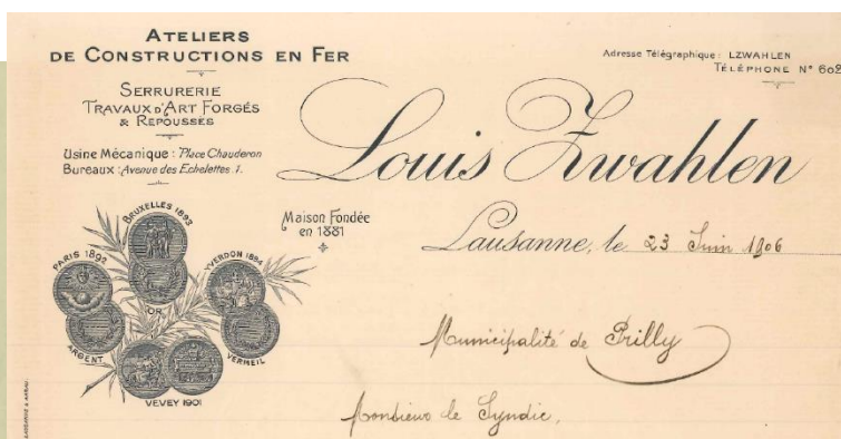
Lettre de 1906