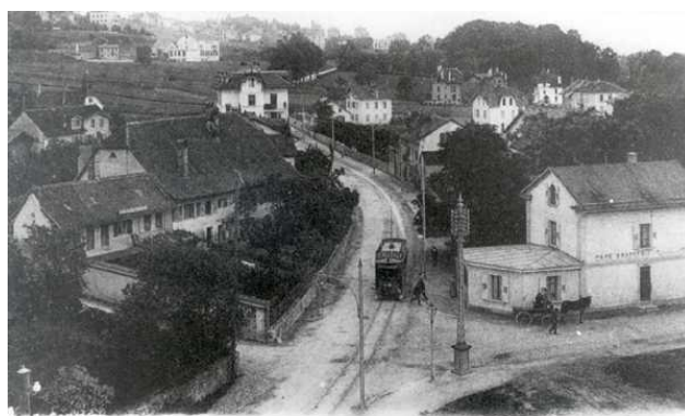
Le café des Marronniers, 1906-1907