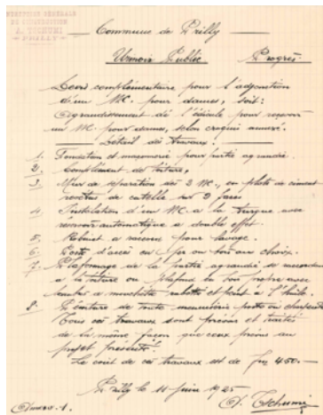
devis écrit par M. Tschumi

Le 11 juin 1925 il a écrit le devis complémentaire pour l'adjonction de toilettes publiques pour femmes à Prilly