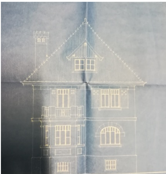
projet de la villa

En 1924, M. Tschumi réalise le projet de construction d'une villa en "Sus Vellaz".