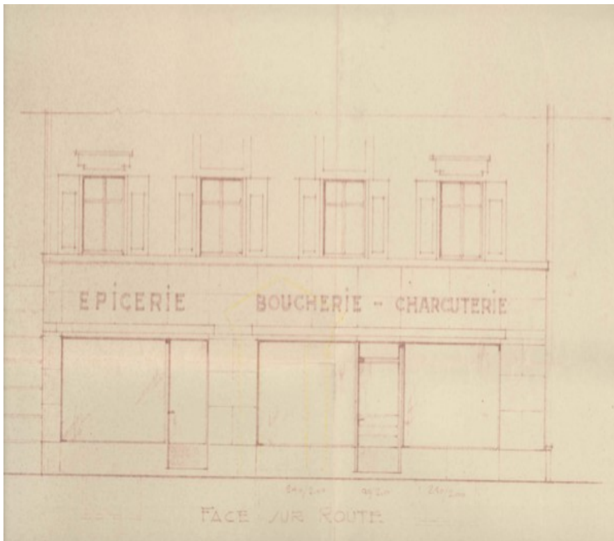
Le projet de la façade de la Boucherie en 1948

En 1909 la Pernette été une laiterie – charcuterie puis en 1919 une boucherie-charcuterie. Aujourd'hui la Pernette est au n°33 de la route de Cossonay mais elle n' est plus en service.