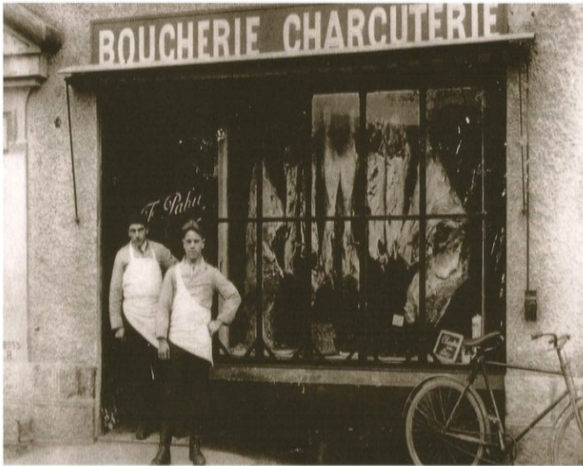
La Boucherie Pahud 1930