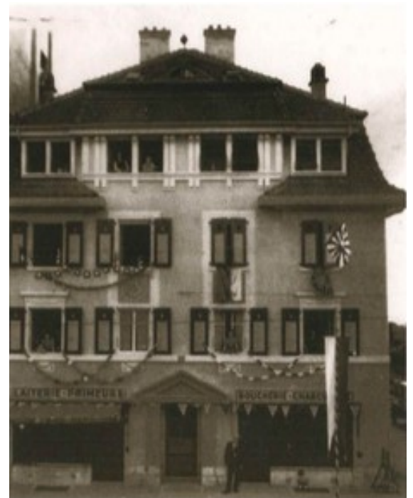
La Boucherie en 1950