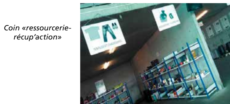
Coin «ressourcerie- récup'action»

Vous y trouverez également une « ressource-ricup'action », un espace d'échange pour y déposer vos objets en bon état susceptibles d'intéresser d'autres personnes. Et en reprendre d'autres dont vous auriez l'utilité. Attention, cependant, les appareils électroniques, électroménagers de même que tout objet volumineux sont exclus de ces échanges! Vous trouverez de plus amples renseignements directement sur place.