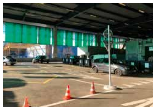
Nouveau traçage au sol