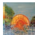
LIEN PHUONG NGUYEN 26 sept. – 1 oct.