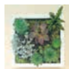
EWA BAEZA-WERNER 29 août – 3 sept.