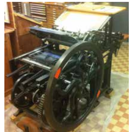
Une presse rare... à découvrir !

Atelier-Musée Encre & Plomb, rue de la Gare 34, 1022 Chavannes-près-Renens. www.encretplomb.ch