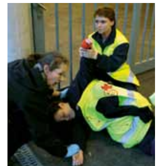
La victime doit être rassurée, l'intervention des secouristes doit être expliquée au patient.