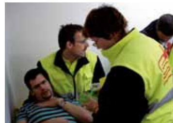
Prise en charge d'un patient ayant de la peine à respirer.

Le Centre Intercommunal de Glace de Malley (CIGM) a accueilli une cinquantaine de samaritains venant des sections de Prilly, Chessaux, Echallens et Cossonay pour un exercice d'envergure. Après une visite du site, les samaritains ont été confrontés à différentes situations pour tester leurs connaissances et entraîner leurs réactions. Qu'il s'agisse d'un doigt amputé