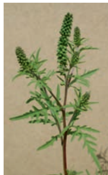
Ambrosie en début de floraison à Buchillon.

est trop grand, lutter avec des herbicides. Les produits à base de glyphosate (Roundup, etc.) ont une bonne efficacité sur des plantes de plus de 20 cm. Les herbicides pour gazon sont efficaces. Une éradication n'est pas possible, mais une lutte systématique permet de maintenir la population d'ambrosie à un bas niveau qui ne provoque pas de problème de santé publique. La SPP remercie tous ceux qui participent activement à la lutte contre ce fléau végétal.